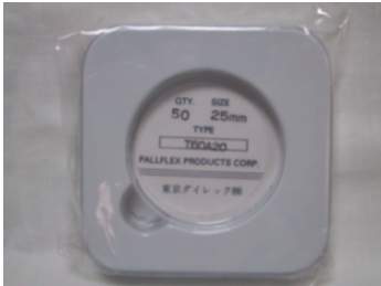
テフロンバインダーフィルター T60A20 規格:φ25mm φ35mm φ47mm φ55mm φ80mm φ110mm ※規格をご指定下さい。 価格(税別):お問い合わせ下さい。