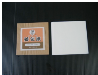
薬包紙 (90×90mm) 価格(税別):280円