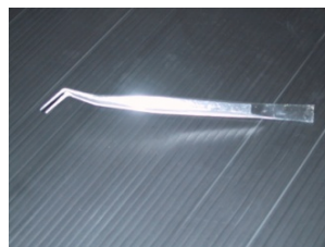
ピンセット 歯科用 価格(税別):1,820円