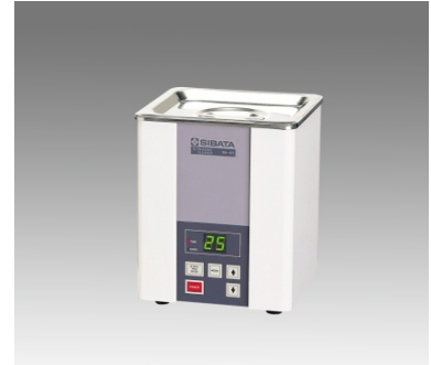
超音波洗浄機 タイマー付 SU-2T 型式: SU-2T 洗浄槽容量: 2L 洗浄槽材質: SUS304 外寸法: 176(w) × 162(D) × 210(H)mm 槽内寸法: 123(w) × 110(D) × 90(H)mm 重量: 約3.1Kg 価格(税込): 105, 000円