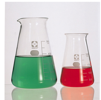
コニカルビーカー 200ml 価格(税別):700円