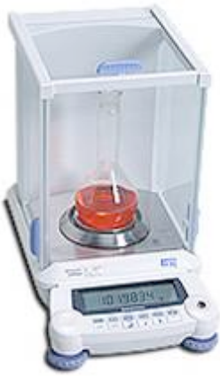
天秤 AUW220D 価格(税別): 290, 000円