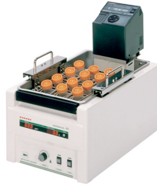
振とう恒温槽 恒温槽: パーソナル11 温調部: サーマンダーSX-10R 使用温度範囲: 室温+5~+70℃ 温度精度: ±0.05℃~ 価格(税別): 300, 000円