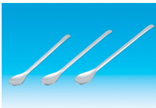
薬さじ(大) 価格(税別):90円～