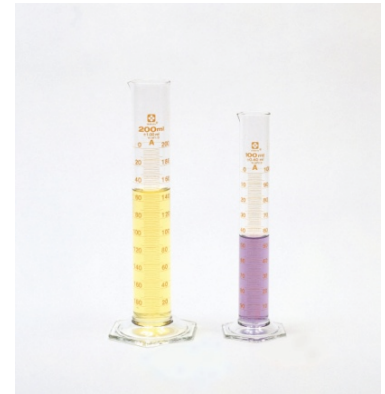
メスシリンダー 50ml スーパーグレード 価格(税別):1,870円