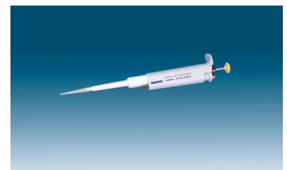
マイクロピペッター(デジフィット) 価格(税別):お問い合わせください

※上記価格には消費税が含まれておりません。※上記価格は都合により変更する場合があります。