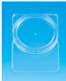
ペトリスライド(φ47mm用 100枚入) 価格(税別):13,000円