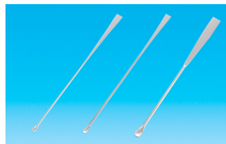
ミクروسパーテル (平板タイプ) 価格(税別):130円～